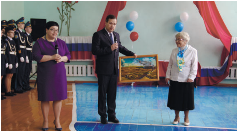
Кадетское братство Зайковской первой школы развивается. 16 ребят стали виновниками волнительного и значимого события

В конце прошлой недели, накануне Дня космонавтики, состоялось торжественное мероприятие посвящения в кадеты 16 пятиклассников Зайковской средней общеобразовательной школы №1 им. дважды Героя Советского Союза Г.А. Речкалова.