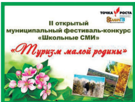
II открытый муниципальный фестиваль-конкурс среди школьников.

В этом году представителям школьных СМИ предлагалась одна общая тема для работы: «Туризм малой родины». Конкурс начинающих журналистов проводился по направлениям «Буклет-путеводитель», «Рекламный ролик», «Статья» и «Фото». В конкурсе принимали участие отдельные авторы – учащиеся образовательных учреждений общего и дополнительного образования Ирбитского района. Цель фестиваля-конкурса является содействие самореализации и развитию творческих способностей детей и подростков, выявление и поддержка одарённых детей, привлечение детей, подростков и молодежи к социальной активности, повышение уровня их медиакультуры. А также создание условий для профориентации детей и подростков, содействие